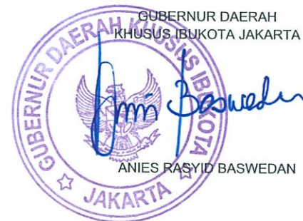
ANIES RASYID BASWEDAN